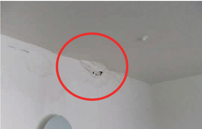
Infiltration d'eau sous la peinture

Dans les endroits où il y a un excès d'humidité, on peut souvent remarquer des traces de moisissures sur les murs et plafonds. En général, on en retrouvera dans le bas des murs (sur les plinthes) ou dans les coins (coins de murs et coins entre le mur et le plafond). Pour plus d'informations sur les moisissures, consultez la fiche 2.5.12.