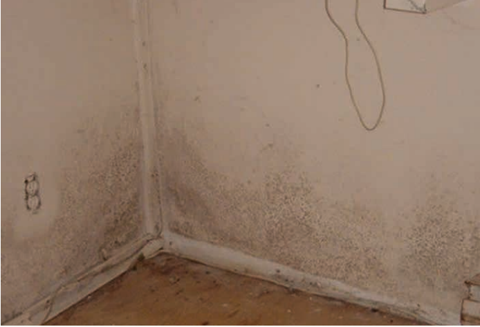
Mur couvert de moisissures