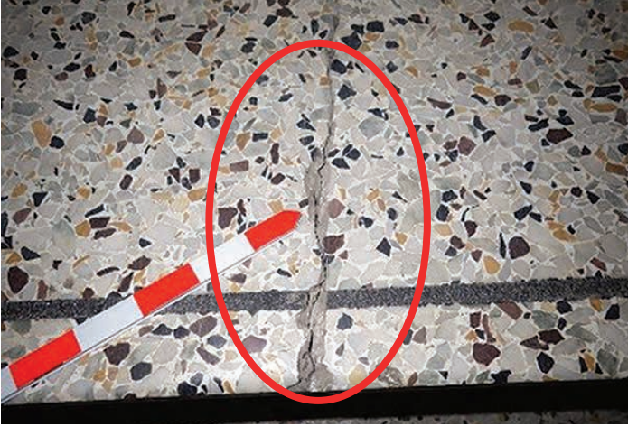
Fissure dans une marche

défectueux. Ces derniers doivent toujours être en bon état. Le nez de marche (en caoutchouc, en bois ou en métal) est souvent en mauvais état. Des parties qui se détachent ou qui sont absentes passent souvent inaperçues, ce qui peut représenter un risque pour la sécurité. L'entretien de ces composants doit être effectué régulièrement. Lorsqu'ils sont peints, ces composants doivent être traités avec attention. La peinture qui y est apposée doit comporter des produits antidérapants, plus particulièrement sur les marches. Il y a aussi possibilité de coller une bande antidérapante sur l'avant des marches et paliers. Peu importe la solution, il faut s'assurer que la surface ne présente aucun danger pour les occupants.